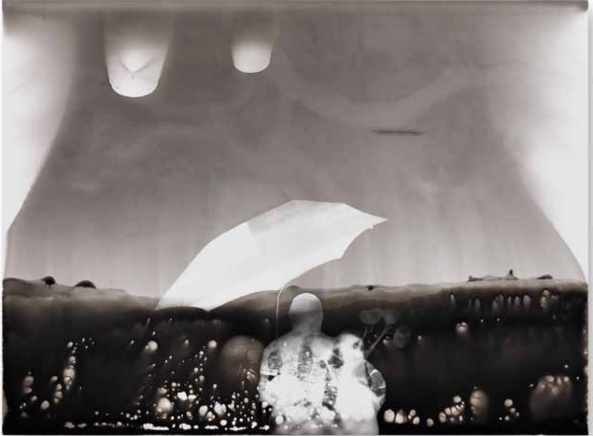
resim çekmek II taking a picture II | fotogram photogram | 17,8 x 24 cm | 2018