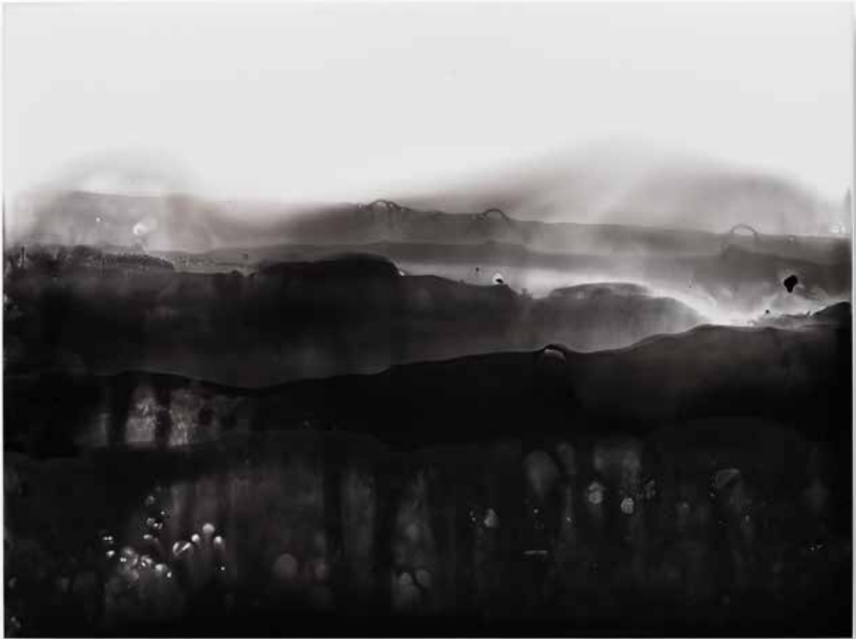
miselyum III mycelium III | solarizasyon solarisation | 17,9 x24 cm | 2017