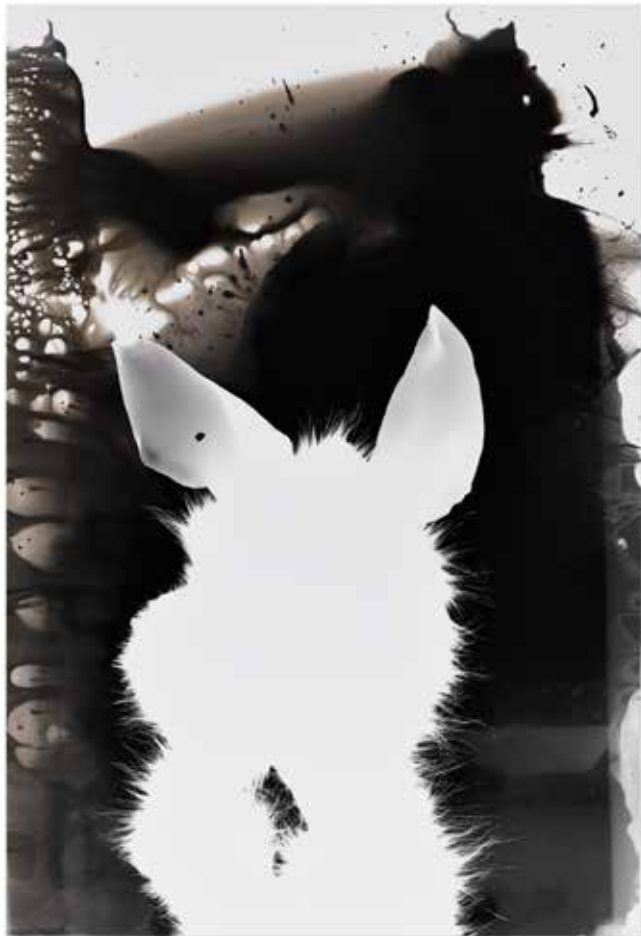
do yu | fotogram photogram | 63 x 43 cm | 2018