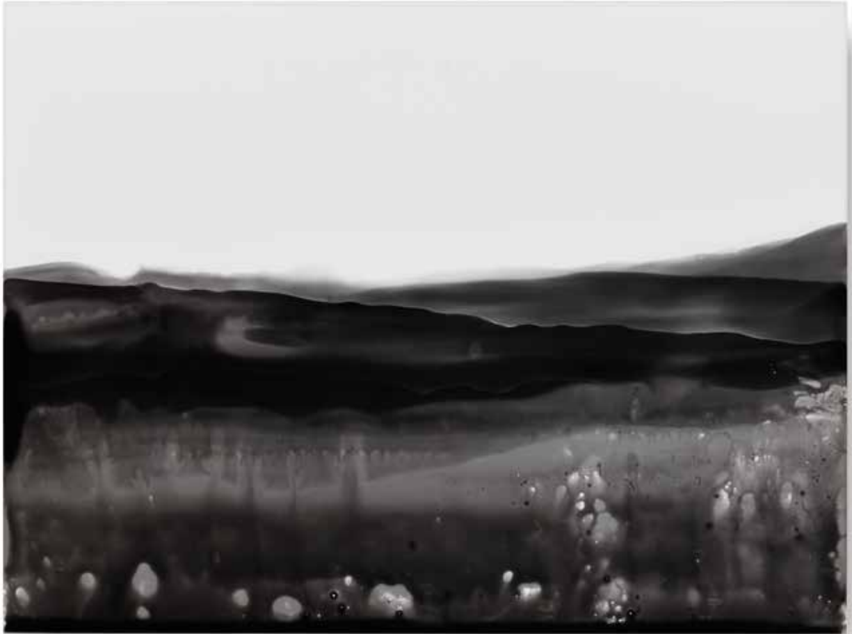
miselyum I mycelium I | solarizasyon solarisation | 17,9 x 24 cm | 2017