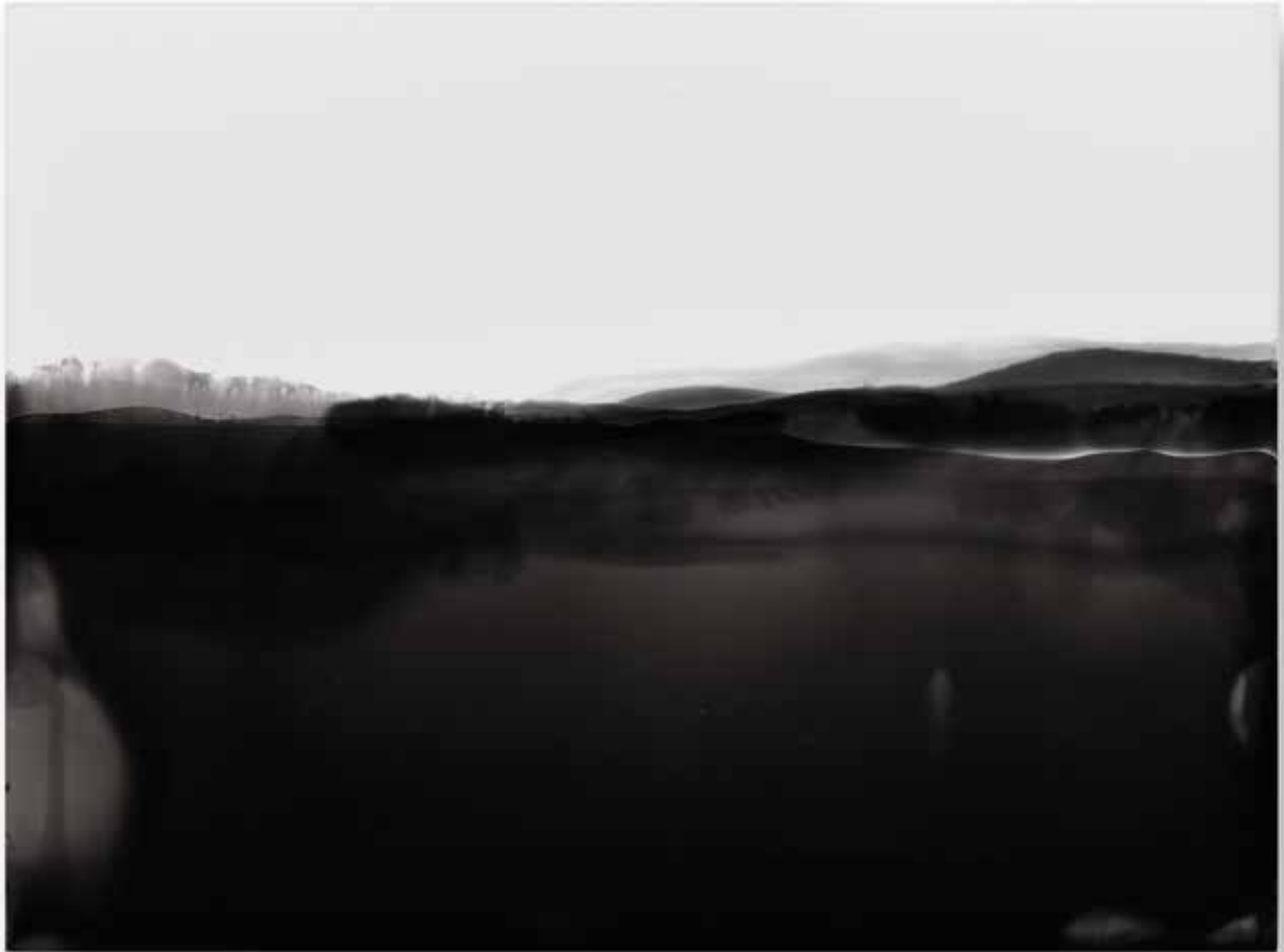
miselyum II mycelium II | solarizasyon solarisation | 17,9 x 24 cm | 2017