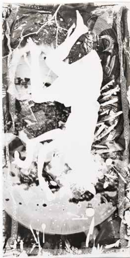
ambrosia ambrosia | fotogram photogram | 243 x 122cm | 2018