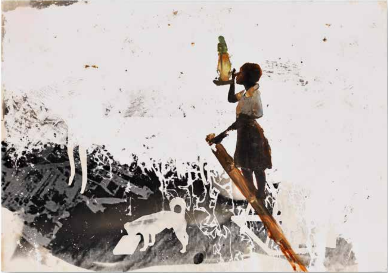
isimsiz. untitled | fotoğraf kağıdı üzerine karışık teknik. mixed technique on photographic paper | 21 x 29,7 cm | 2014