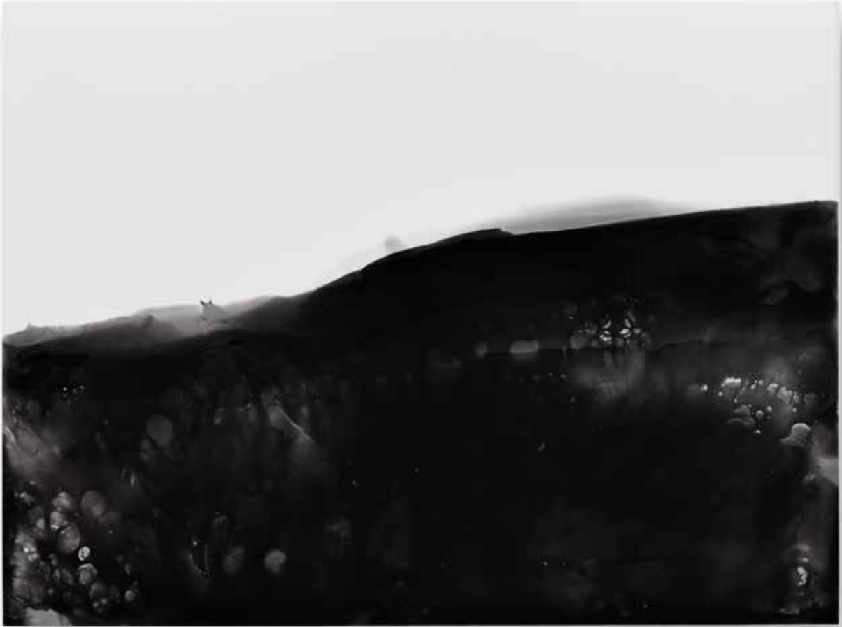
miselyum IV mycelium IV | solarizasyon solarisation | 17,9 x 24 cm | 2017