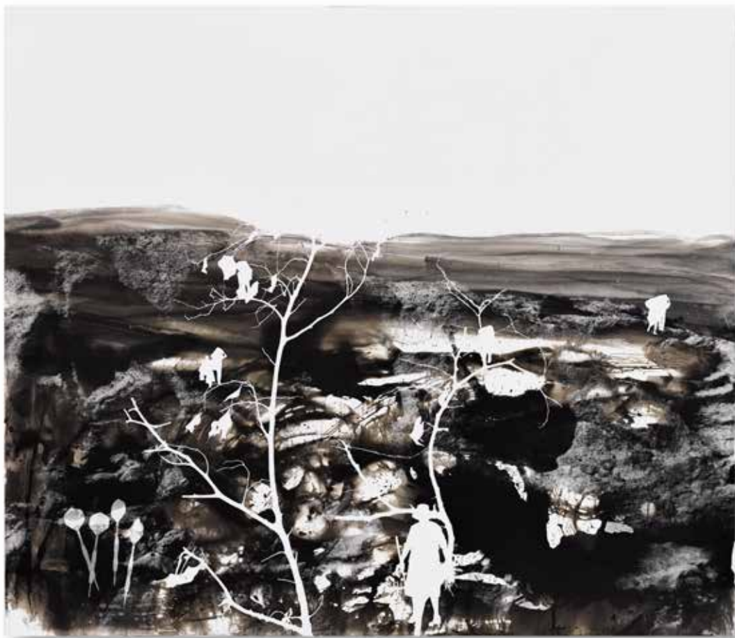
ayrik otu couch grass | fotogram photogram | 108 x127 cm | 2018