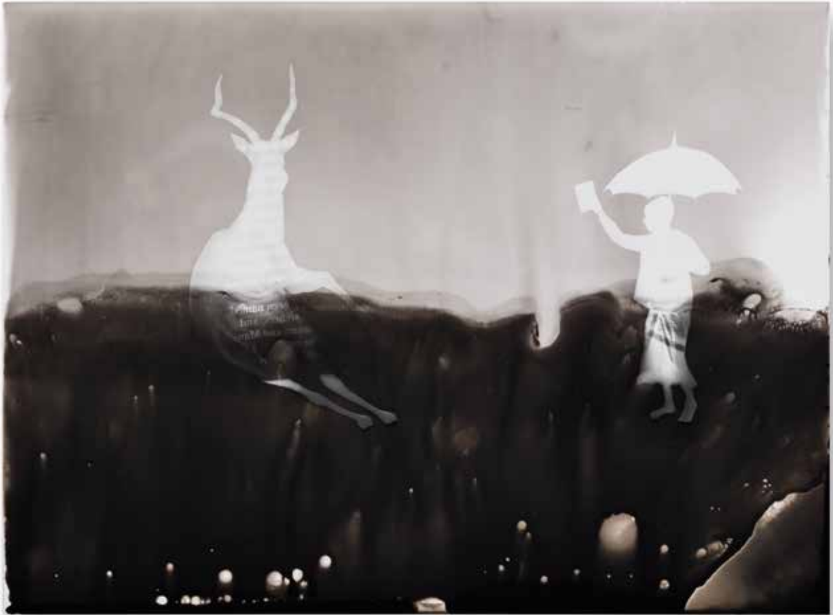
resim çekmek I taking a picture I | fotogram photogram | 17,8 x 24 cm | 2018